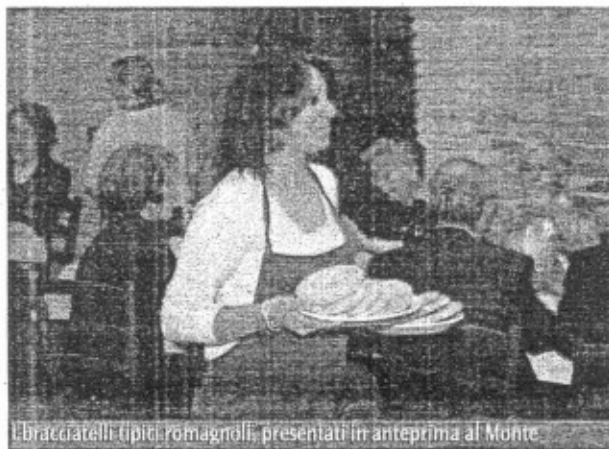
I bracciatelli tipici romagnoli, presentati in anteprima al Monte

Grazie a una ricerca del giornalista Gabriele Papi, è stata distribuita una scheda illustrativa che racconta l'antica storia del bracciatello, con notizie storiche dimenticate. Già dall'anno Mille si trovano citazioni del "bracidellus", o "brazidellus" (da cui il termine romagnolo "brazadel"). Già allora erano una sorta di ciambella con il buco, che i venditori antichi proponevano infilati nel braccio (da cui il nome: bracciatello), oppure inanellati in un bastone. Iniziava dunque il lungo e gustoso dei bracciatelli, che ricompaiono frequentemente nelle cronache dei tempi malatestiani e nell'arco dei secoli successivi, insieme al perfezionamento delle tecniche di elaborazione e di cottura. Nel Settecento, e fino ai giorni nostri, il bracciatello diventava sempre più dolce beneagurante, rituale nell'accompagnare - sulle tavole romagnole i battesimi, le cresime, le comunioni, le feste comandate. Un documento ottocentesco riporta precisi "comandamenti" nelle nostre campagne: ad esempio, in occasione del pranzo che festeggiava un neonato, la mamma della puerpera doveva preparare un "paniere di bracciatelli, di ova, zucchero e ben lavorati" con, in cima al ce-